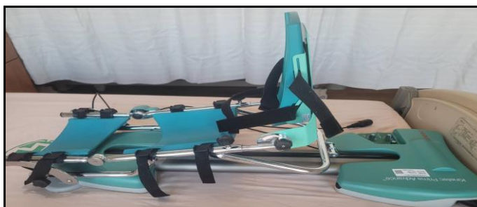
圖三 連續性被動式關節活動器