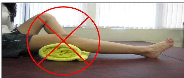
圖一 枕頭勿置於膝下

(一)臥床時將患肢抬高促進血液循環，勿將枕頭置於膝下(圖一)，應放小腿處(圖二)，保持膝蓋伸直。