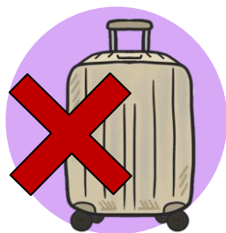
隨身攜帶胰島素 勿放行李箱