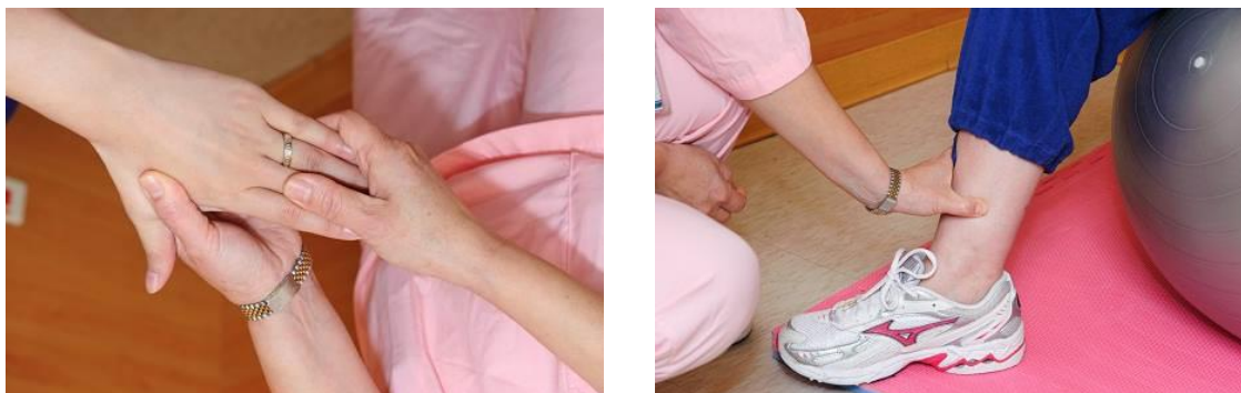
圖七、按摩或穴位按壓

藉由手指指腹、大姆指或指關節按壓合谷穴、三陰交穴(腳踝骨內側上方三吋脛骨的背脊處)，進而達到氣血調暢、減緩疼痛。