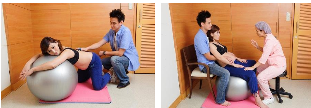
圖八、運用生產球改變姿勢

由生產球改變姿勢，讓身體與骨盆隨之擺動，可降低背部的疼痛感。也能支撐會陰減少過度的壓力，轉移身體的重量。