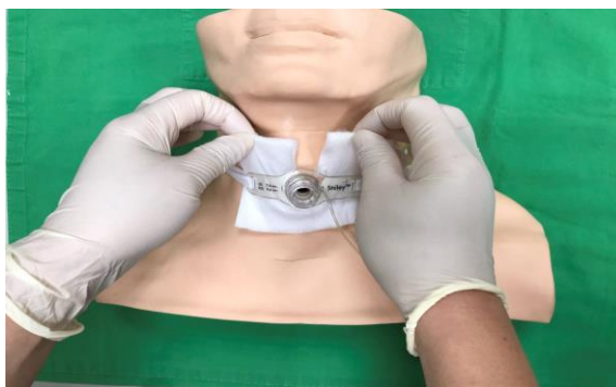
圖三 Y 紗覆蓋

(八)檢查頸繫帶是否過緊或過鬆，以能放入 1-2 指寬為原則，若繫帶髒濕，則予更換，並固定於頸部側邊(圖四)。