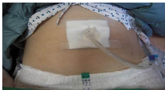
圖四 胃造口固定方式