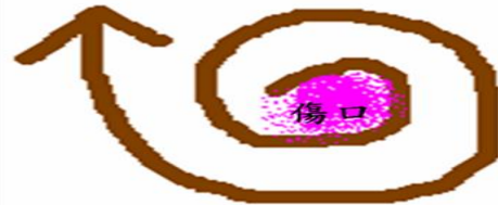
以傷口為中心 由內往外環狀清潔消毒