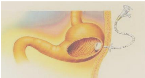
圖一 胃造口位置解剖圖

藉由內視鏡的輔助，經皮穿刺到胃中放置管子(如圖二)，即為胃造口(如圖一)。主要是用來灌食以提供營養，也可經此管路抽取胃內容物或引流以減輕胃脹不適。