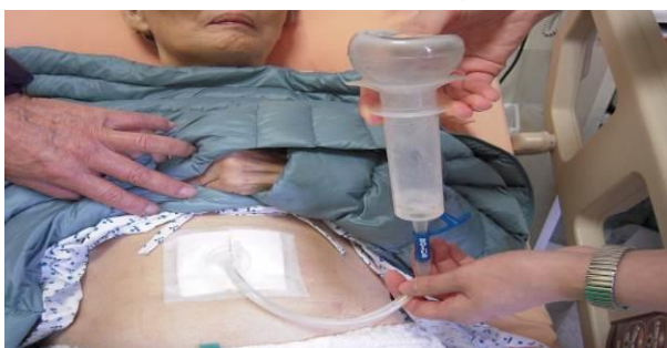
圖三 灌食前確認胃造口位置