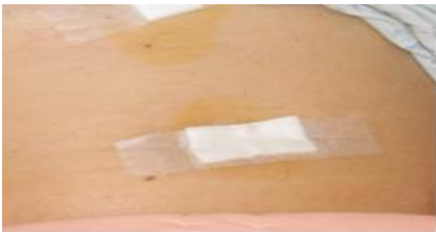
圖一 保持傷口紗布(不防水)乾燥