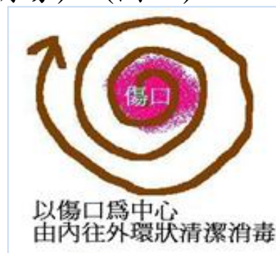
圖四 傷口環狀消毒方式