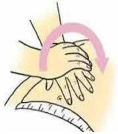
圖三 子宮按摩方式