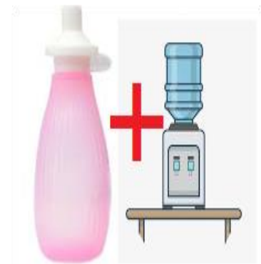
圖一 沖洗時使用沖洗器並裝溫開水